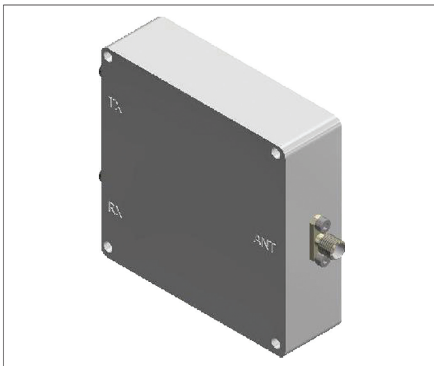
▲ Рис. 3. Мощный дуплексер MCD046

и 1120 МГц составляет 35 дБн. Подавление второй гармоники не менее 70 дБн.