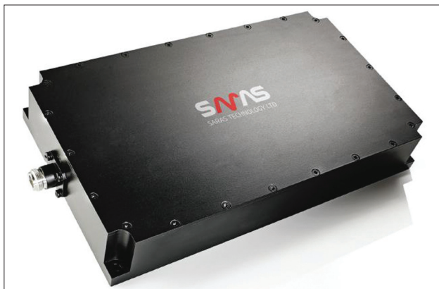
▲ Рис. 2. Двухдиапазонный полосовой фильтр MDB001